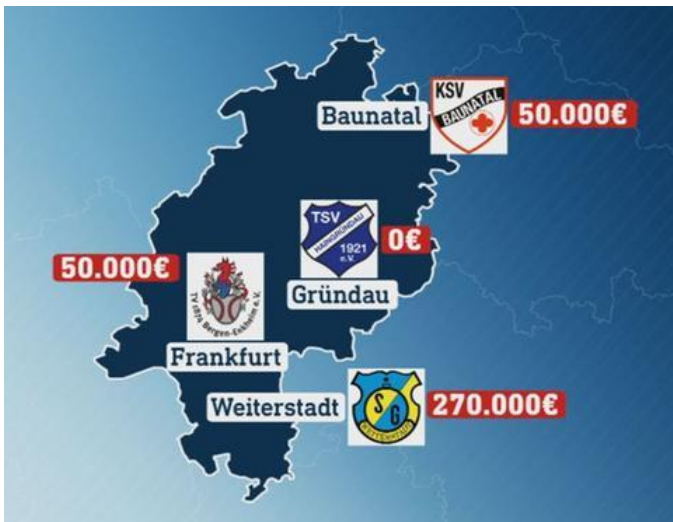
Die meisten Sportvereine rechnen mit einer Ver...

Nicht nur in Bergen-Enkheim rechnet man mit einer großen Belastung für die Vereinskasse. Die Energiekrise trifft nahezu alle hessischen Vereine. Auch der KSV Baunatal, der größte Club aus Nordhessen, rechnet mit 50.000 Euro Mehrkosten für das nächste Jahr. Die südhessische SG Weiterstadt befürchtet sogar, 270.000 Euro mehr zu zahlen als in den Vorjahren.